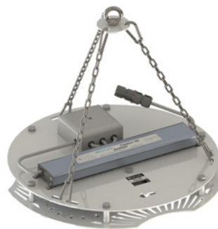
Светильник ПСС-90 РАДИАНТ; крепление на трос, IP65